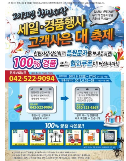
[대전 한민전통시장 공동마케팅 포스터]