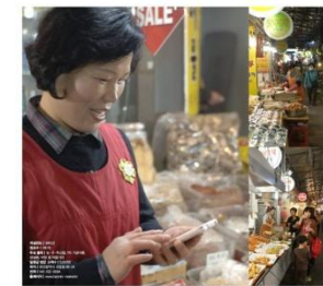
[시경영진흥원, 공동마케팅 우수사례 선정]